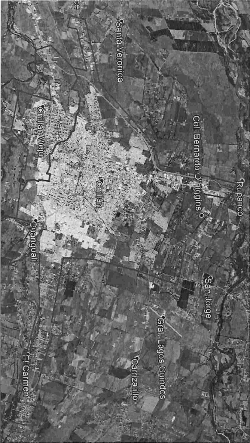
MAPA DE LOS LÍMITES URBANOS DE MAYOR DENSIDAD POBLACIONAL DE LAS COMUNAS DE CHILLÁN Y CHILLÁN VIEJO, REGIÓN DE ÑUBLE.