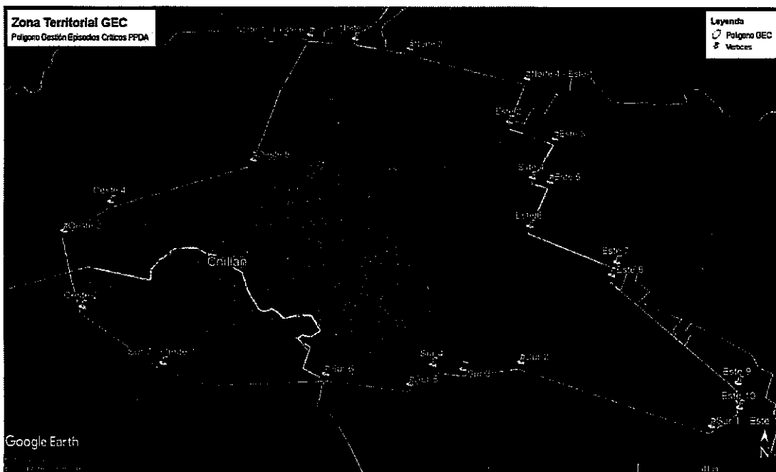
Imagen 1: Polígono Referencia Zona Territorial GEC.